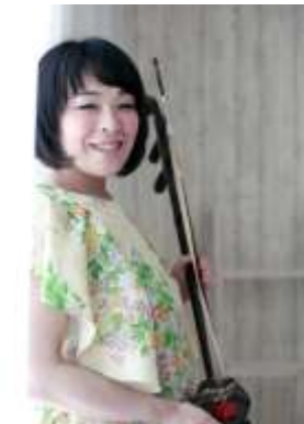
出會深雪（二胡・高胡）