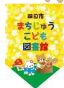
▲参加店の目印の旗