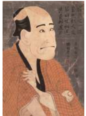
上：東洲斎写楽 《二代目嵐龍蔵の金貨石部金吉》 寛政六年(1794) 壺大判錦絵

開館時間：9:30～17:00 (入場は16:30まで) 休館日：月曜日 (4月30日(休)は開館) 観覧料：一般800円、 高大生600円、 中学生以下無料