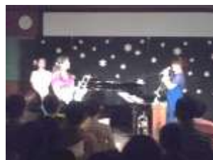
【演奏: トリオ・クーナ】