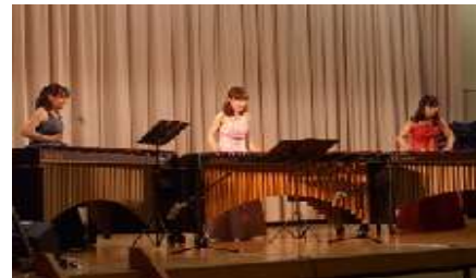
出演者：マリンバトリオ・ジュテーム