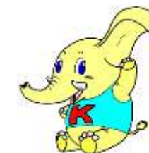
広聴イメージキャラクター「きくソー」