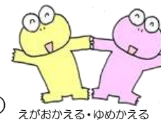
えがおかえる・ゆめかえる