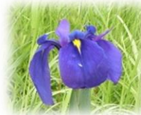
ノハナショウブ（5月頃）