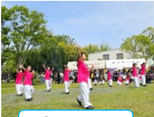
「Coconattu」の ヒップホップダンス！