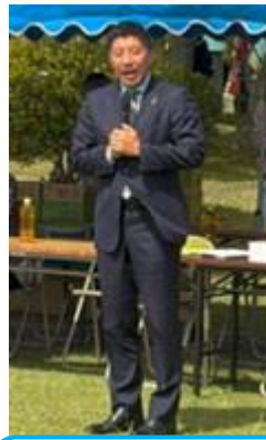
森 智広 四日市市長