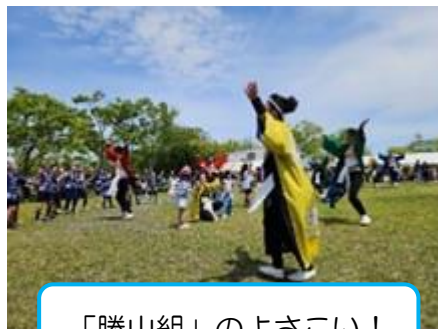
「勝山組」のよさこい！