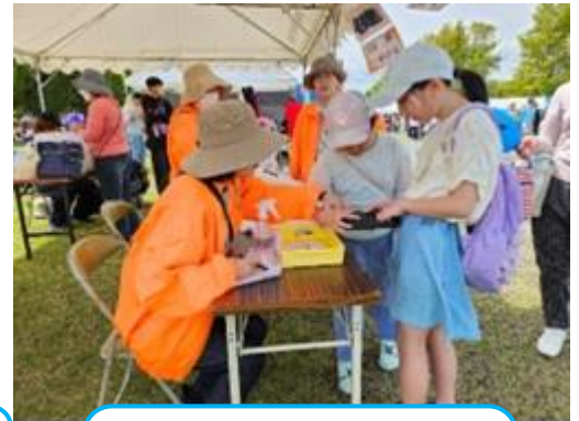
健康チェック 握力測定 コーナーは、 こどもたちにも大人気！