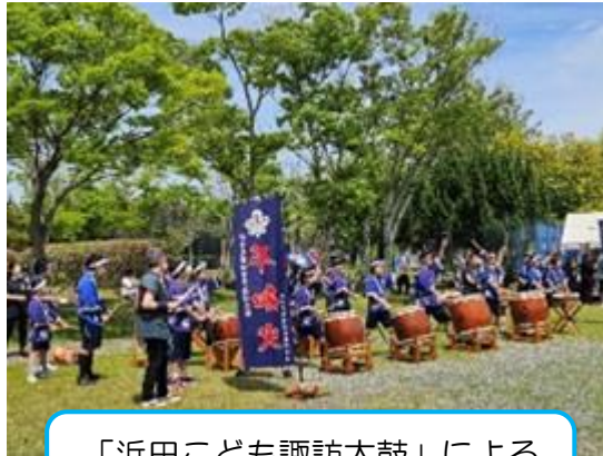
「浜田こども諏訪太鼓」による 諏訪太鼓演奏！